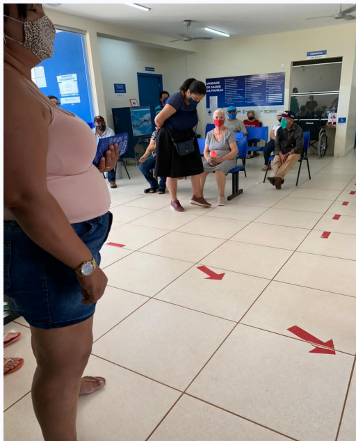
Organização da unidade