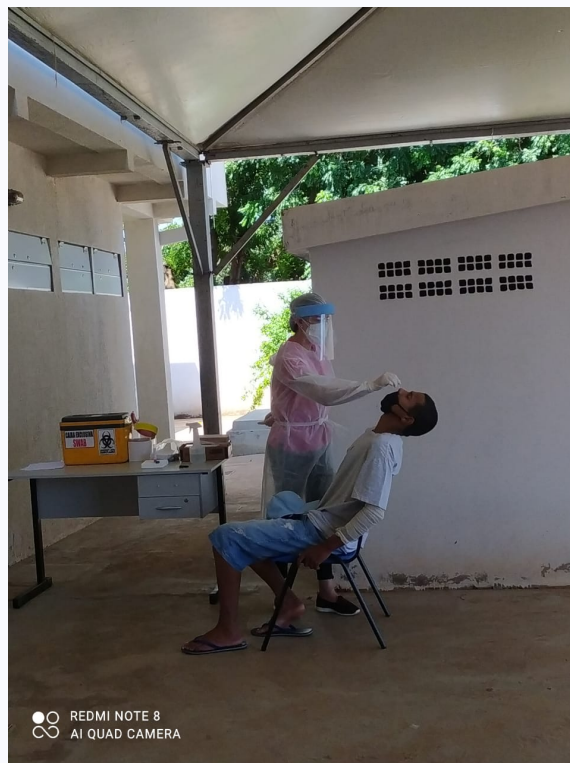
Coleta de Swab