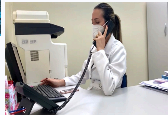
Telemonitoramento de Covid-19