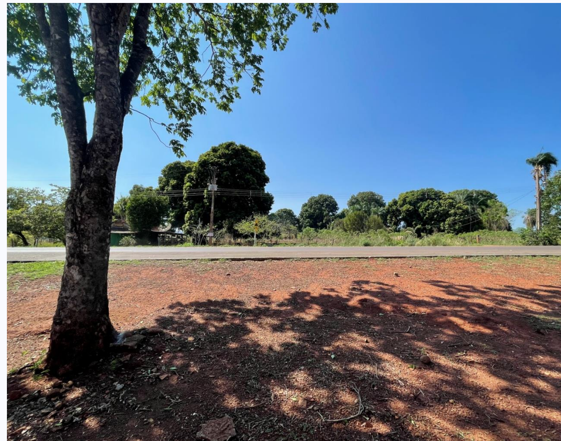
BR 080 KM 35 S/N – Saída para Rochedo