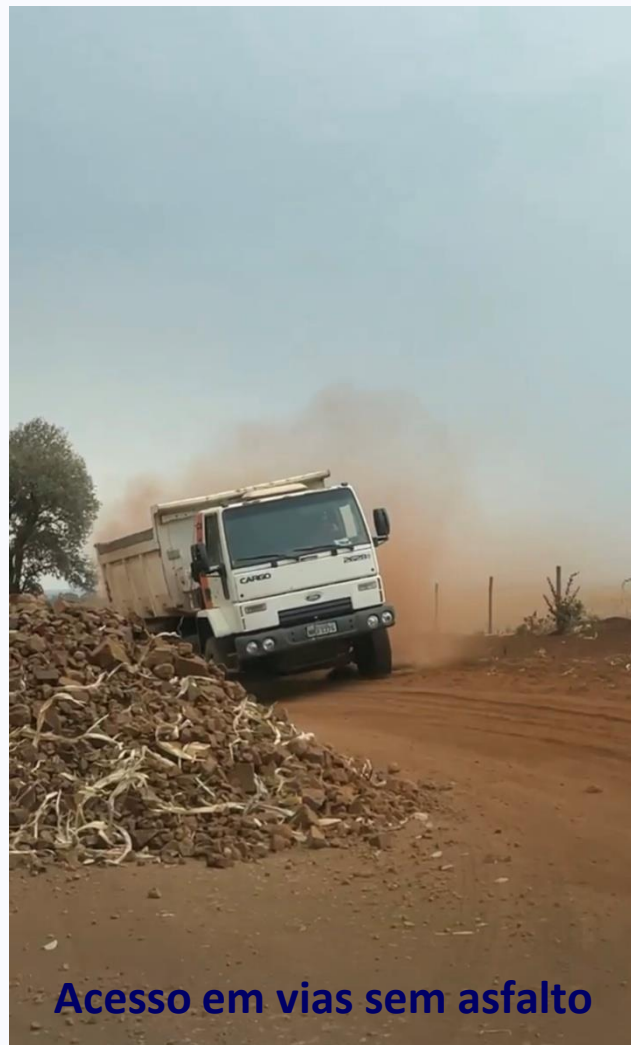
Acesso em vias sem asfalto