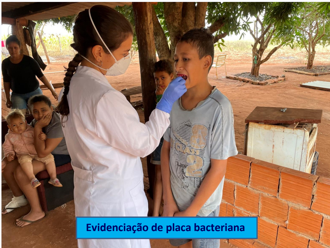
Evidenciação de placa bacteriana