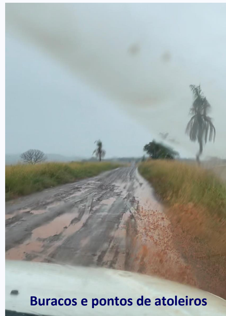
Buracos e pontos de atoleiros