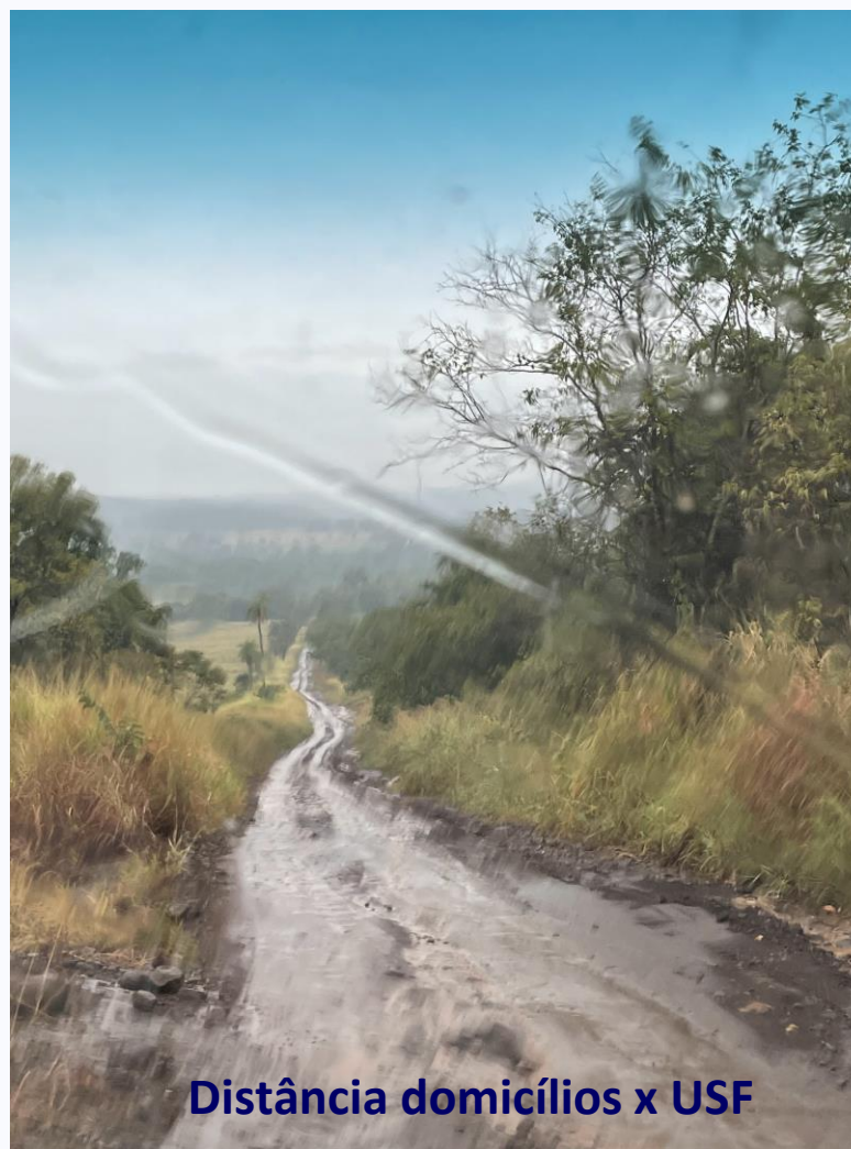
Distância domicílios x USF